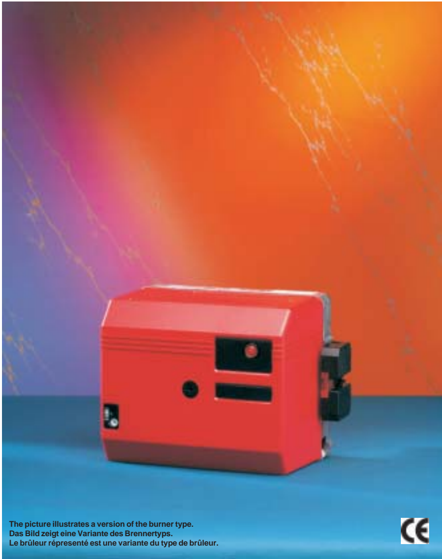
The picture illustrates a version of the burner type. Das Bild zeigt eine Variante des Brennertyps. Le brûleur représenté est une variante du type de brûleur.